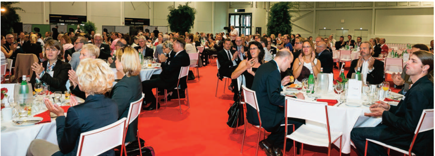
Viel Beifall gab es bei den Redebeiträgen zum doppelten Geburtstag von Pro Hannover Region.