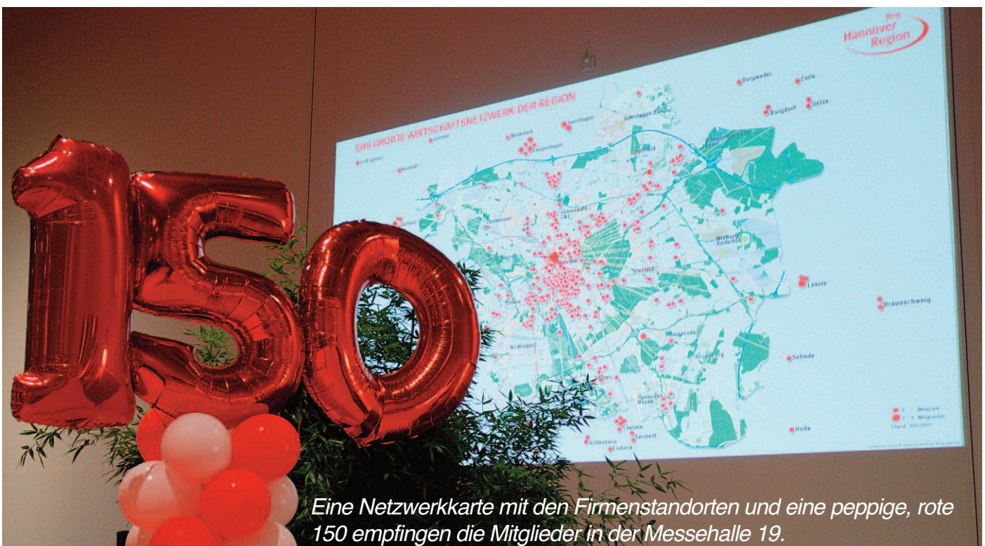
Eine Netzwerkkarte mit den Firmenstandorten und eine peppige, rote 150 empfangen die Mitglieder in der Messehalle 19.